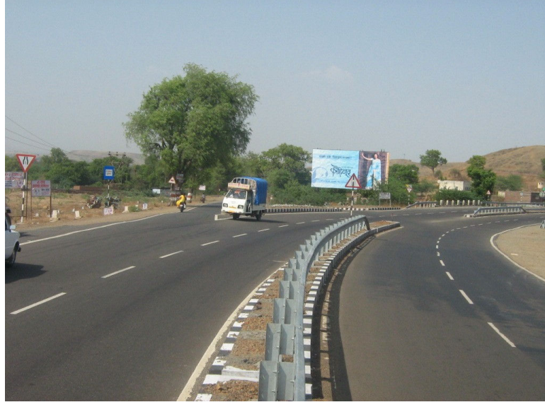
पुणे-शिरूर राज्यमार्गाचे चौपदरीकरण

राज्यातील प्रमुख शहरे उदा. पुणे, नागपूर, औरंगाबाद, जालना, नांदेड, लातूर, उस्मानाबाद, बुलढाणा जिल्हा मुख्यालये चौपदरी रस्त्याने नजिकच्या काळात जोडली जातील. शासनाने राज्यमार्गाच्या खाजगीकरणाच्या कामास शासनाचा ४० टक्के आर्थिक सहभाग देण्याचे धोरण स्वीकारले आहे. या धोरणामुळे राज्यमार्गाचे जाळे विकसित होण्यास मदत होणार आहे. महाराष्ट्र राज्याच्या उपरोक्त धोरणास केंद्र शासनाने प्रतिसाद देऊन सुमारे ५ प्रकल्पांवर रू. ४९१ कोटी आर्थिक सहाय्य देण्याचे मान्य केले आहे.