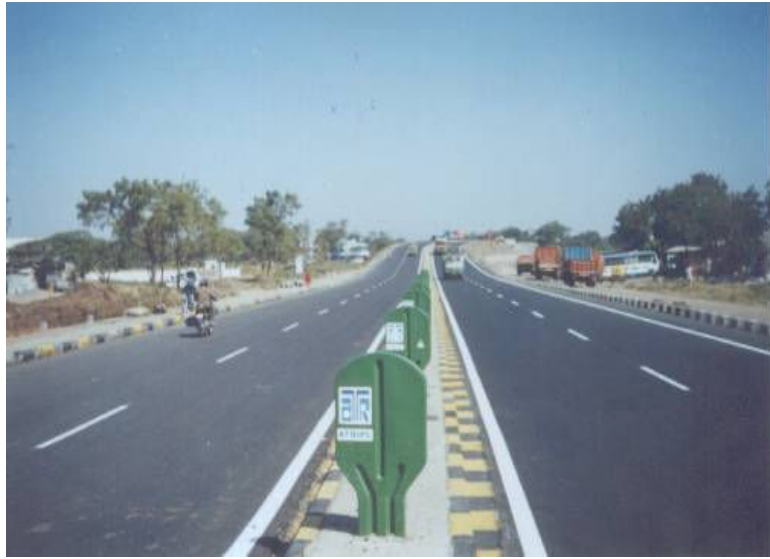
पुणे-नाशिक महामार्गाचे चौपदरीकरण

राज्यातील प्रमुख शहरे उदा. पुणे, नागपूर, औरंगाबाद, जालना, नांदेड, लातूर, उस्मानाबाद, बुलढाणा जिल्हा मुख्यालये चौपदरी रस्त्याने नजिकच्या काळात जोडली जातील. शासनाने राज्यमार्गाच्या खाजगीकरणाच्या कामास शासनाचा ४० टक्के आर्थिक सहभाग देण्याचे धोरण स्वीकारले आहे. या धोरणामुळे राज्यमार्गाचे जाळे विकसित होण्यास मदत होणार आहे. महाराष्ट्र राज्याच्या उपरोक्त धोरणास केंद्र शासनाने प्रतिसाद देऊन सुमारे ५ प्रकल्पांवर रू. ४९१ कोटी आर्थिक सहाय्य देण्याचे मान्य केले आहे.